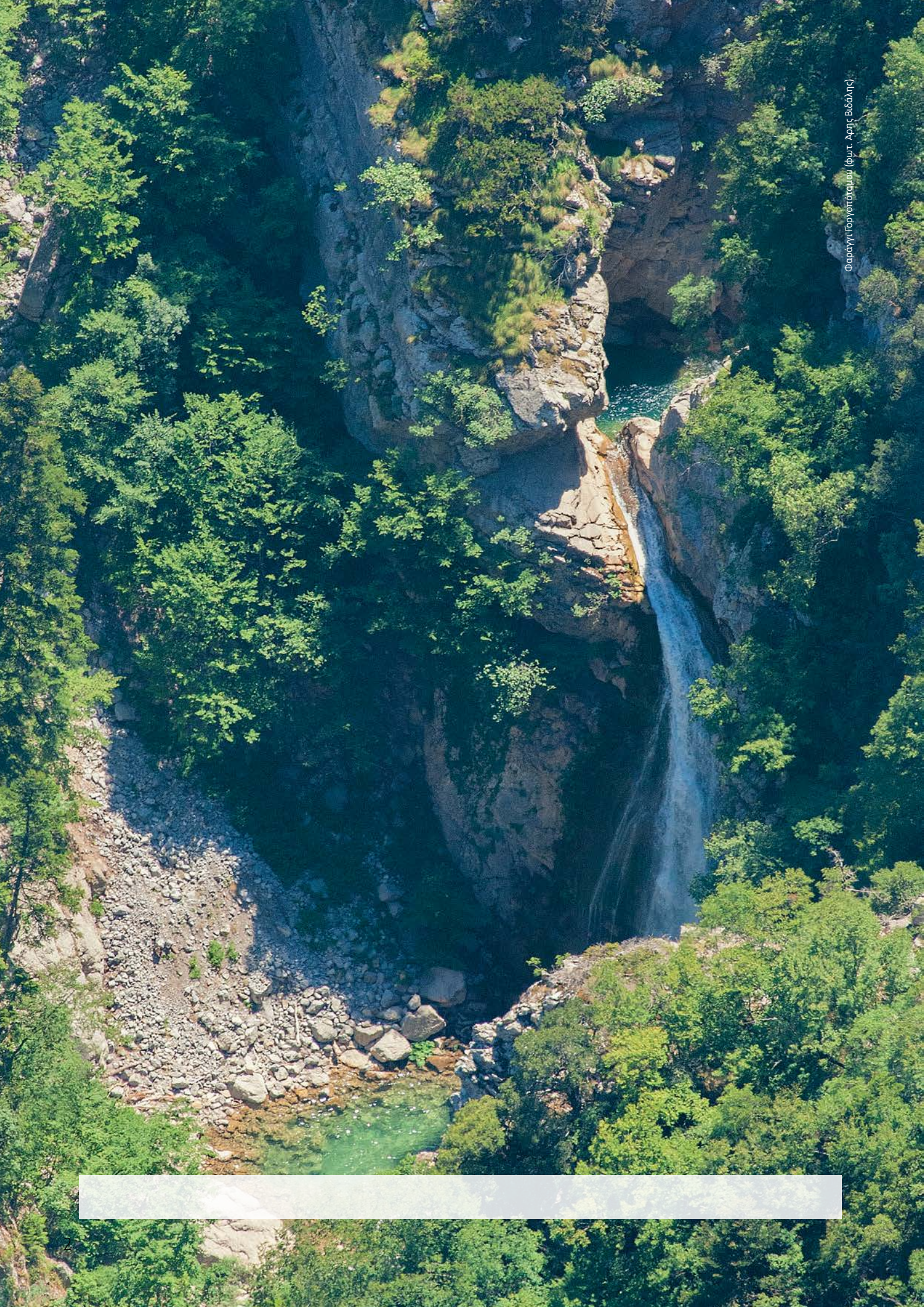
Φαράγγι Γοργοπόταμου